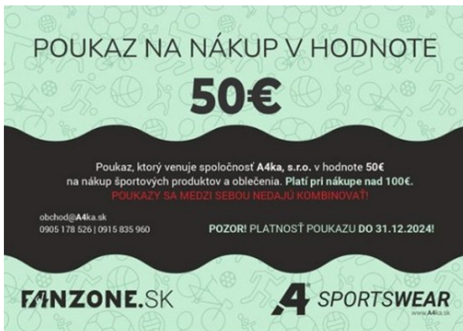
50 € poukaz