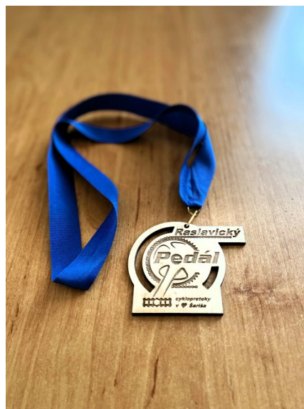
Účastnícka medaila 2024