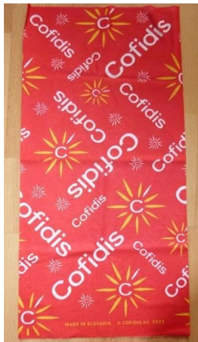
Šatka pod krk