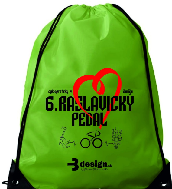
Pre prvých 100 online registrovaných účastníkov s úhradou štartovného batoh