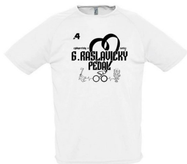
Funkčné účastnícke tričko 2024